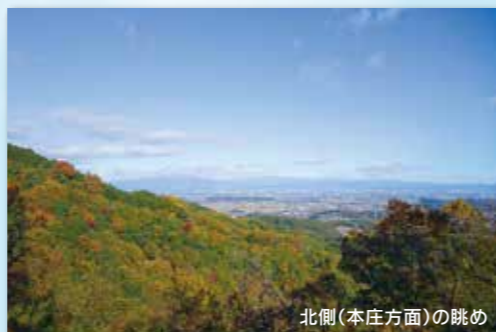
北側(本庄方面)の眺め

陣見山の東へ延びた尾根の山頂に築いた山城です。城は鉢形城の出城であり、その食糧の供給を担当する役目を果たしたと言われており、現在も周辺には空堀の遺構があります。